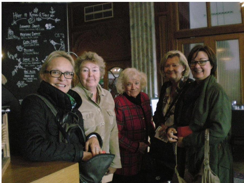
Text & Foto: Lotta Aru