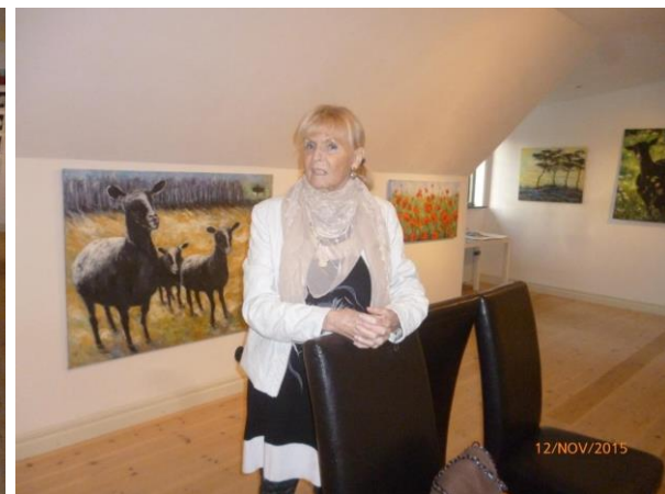
Text och bild: Kerstin Denker