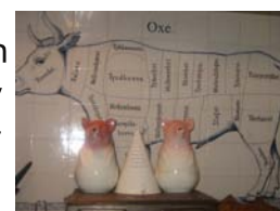
Styckschema över spisen

Det han åstadkommit med huset är enastående; varje rum har sin karaktär och har inretts med största kärlek och omsorg. Redan i köket överväldigades vi av hans välfyllda hyllor. Där vi har en soppterrin, har han tjugo. Samma sak gäller t ex tehuvar som står tätt radade på sin hylla. Spisen är ett underverk i svart och guld.